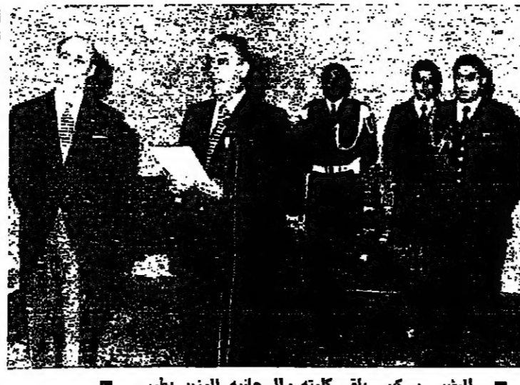
الرئيس سركيس يقبل كلمته والى جانبه الوزير بطرس

نفذ حكم الإعدام ششقا، فجر أمس ثلاثة رجال ادينتهم محكمة سورية باللقاء عدد من التفجرات وقتل عدد من المواطنين الأبرياء، «بتكليف وحرض وتمويل من حكوم العراق». وقد نفذ حكم الإعدام في حلب أحد عميد ربه وهو من سكان غزة في ساحة المرجة بدمشق، كما نفذ في نشاتين في نونين طرطيل وحسين بن أحمد الرازي وهما من سكان مدينة حلب بشمال سوريا، في ساحة باب الفرج في مدينة حلب. وتلقى على الرجال الثلاثة نص الرسوم الخاص بتصفيق الحكم الصادر عليهم. على كل منهم من قبل رئيس الجمهورية، في السجن المركزي في كل من دمشق وحلب فجر أمس واقتيدوا تحت الحراسة المشددة في وقت واحد إلى ساحة المرجة بدمشق وساحة باب الفرج في حلب حيث السوا قتلوا بضوء كعب عليها نص الحكم الصادر بحقهم من قبل محكمة أمن الدولة العليا. وطلت جثمت معلقة على أسوار دمشق حتى الساعة العاشرة من قبل ظهر أمس، وكانت محكمة أمن الدولة العليا - البقية على الصفحة ٧ -